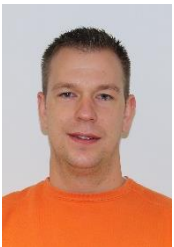
Andi Kälin Werk: E+L Pfäffikon SZ