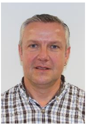
Erwin Schmucki Werk: E+L Pfäffikon SZ