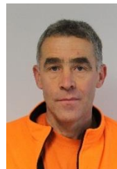
Vinzenz Kuster Werk: Eschenbach