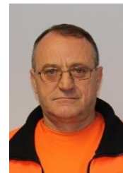
Pren Gjykej Werk: Eschenbach