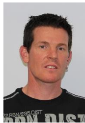
Thomas Wespe Werk: E+L Pfäffikon SZ