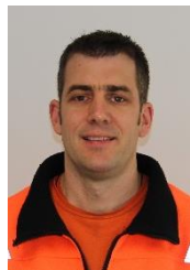
Rolf Bamert Werk: Grynau